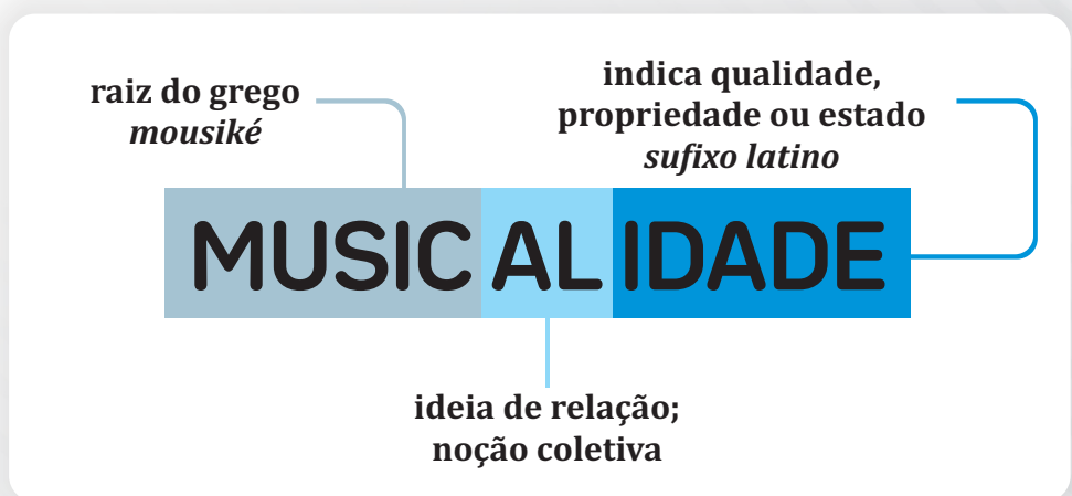
Figura 2. Formação da palavra musicalidade (Baseado em FERREIRA, REBELLO e TIMM, p.8)

Origem tem tudo a ver com as práticas, pois é compreendendo o significado desde a sua raiz que se torna possível a contribuição para o ensino da música de forma eficaz. É isso que faremos agora associaremos os significados dos morfemas aos seus resultados na prática pedagógica.