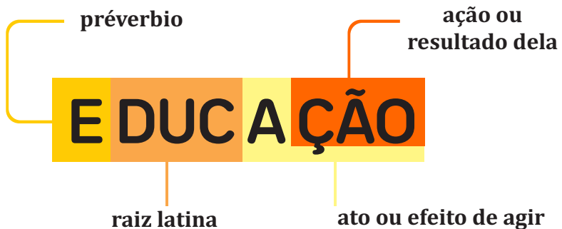
Figura 4. Formação da palavra educação (Baseado em REBELLO e TIMM, p. 8)