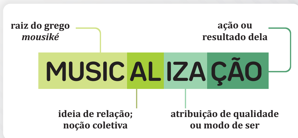
Figura 2. Formação da palavra musicalidade (Baseado em FERREIRA, REBELLO e TIMM, p.8)

Agora vejamos como se compreende a musicalização, assim como a musicalidade, a musicalização não é um eixo do ensino da música exclusivo para criança, e sim, para todo aquele que tem o interesse de aperfeiçoar suas práticas musicais.